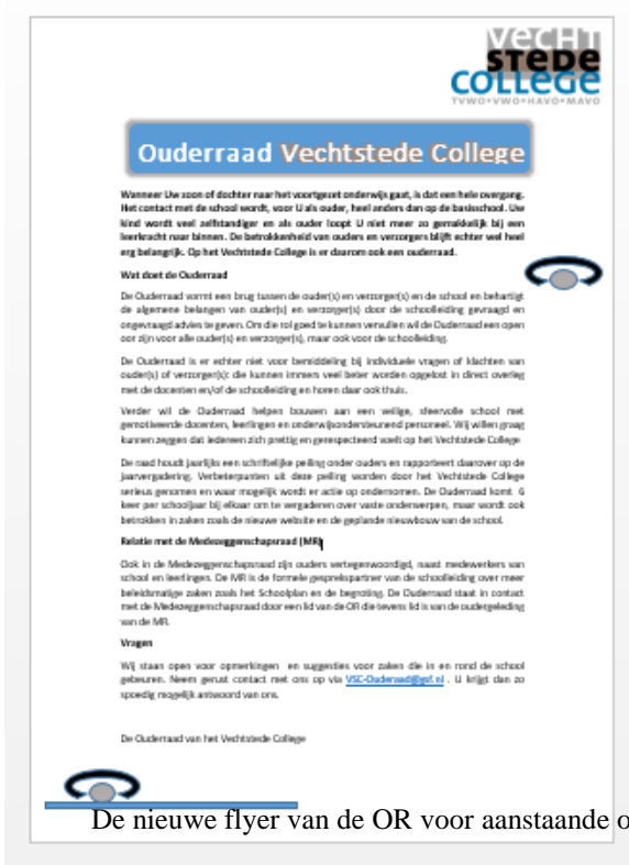
De nieuwe flyer van de OR voor aanstaande ouders en verzorgers